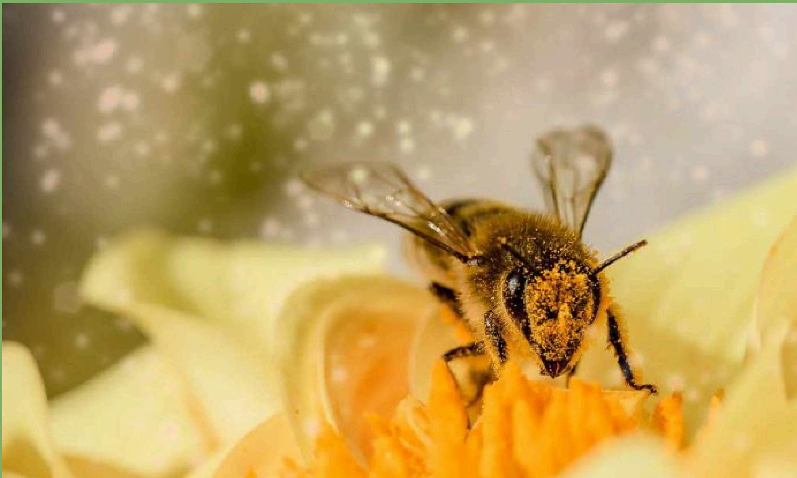
Abelha - nativa - sem - ferrão